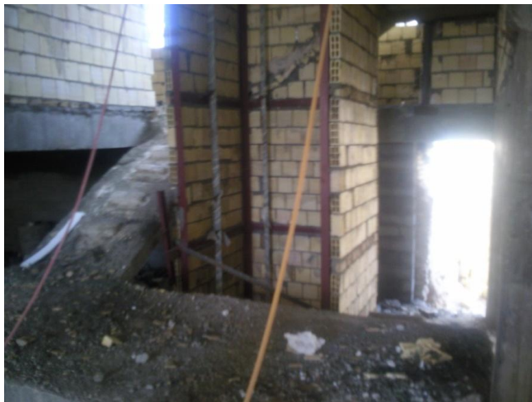
اجرای آسانسور در وسط راه پله