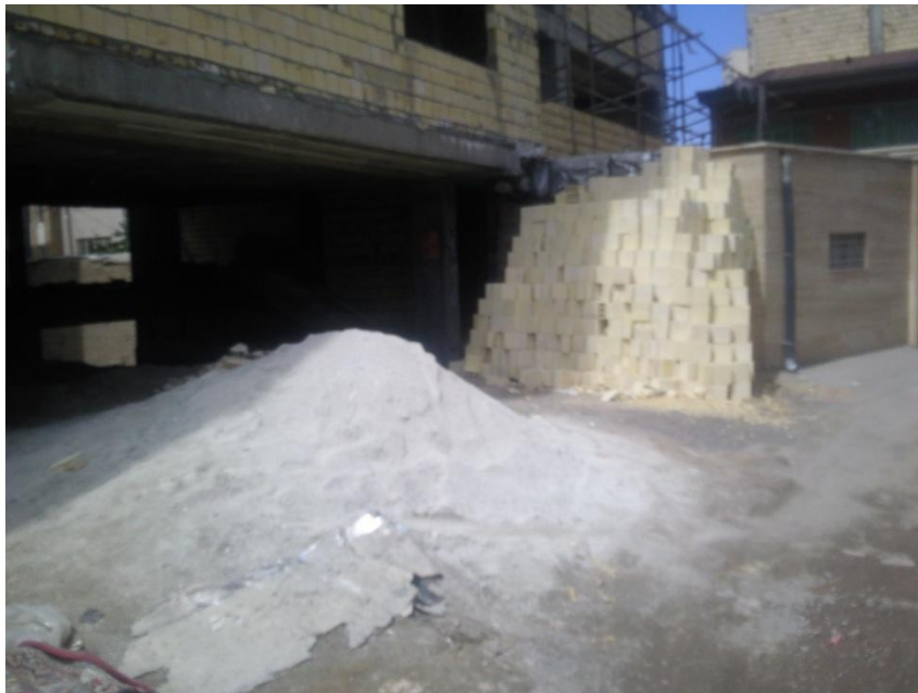
دیو مصالح در معبر عمومی بدون وجود علائم هشدار دهنده