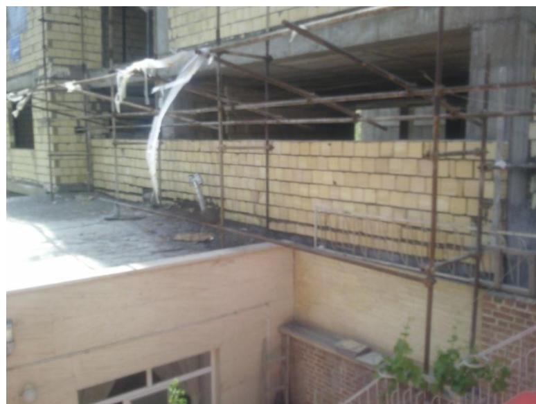
اجرای دیوار خارج از سازه ، قصد اجرای بازشو به پلاک مجاور و اجرای داربست بر روی بام پلاک مجاور