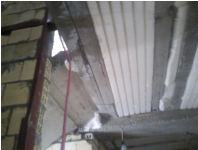
اتصال شمشیری راه پله به قسمت پاگرد توسط جفت تیرچه