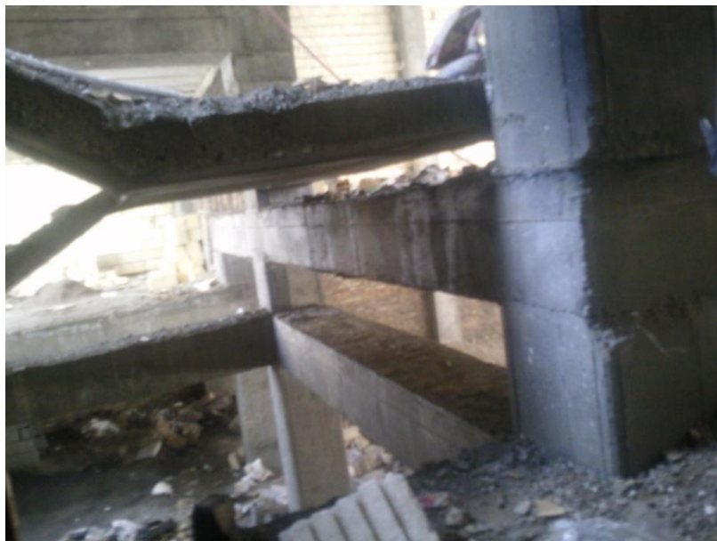
نحوه اجرای تیر نیم طبقه و پاگرد راه پله