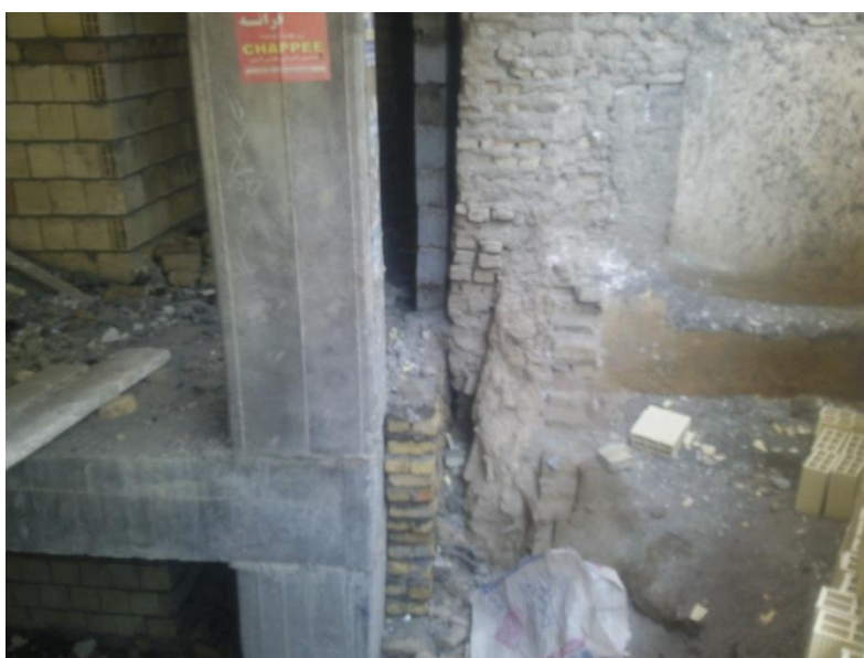
اجرای دیوار خارج از سازه اصلی در پلاک مجاور و محل درز انقطاع