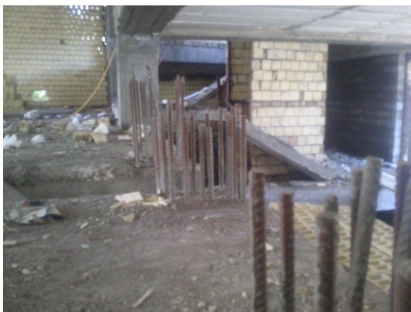
عدم وجود خم در انتهای میلگرد ستون طبقه زیرزمین