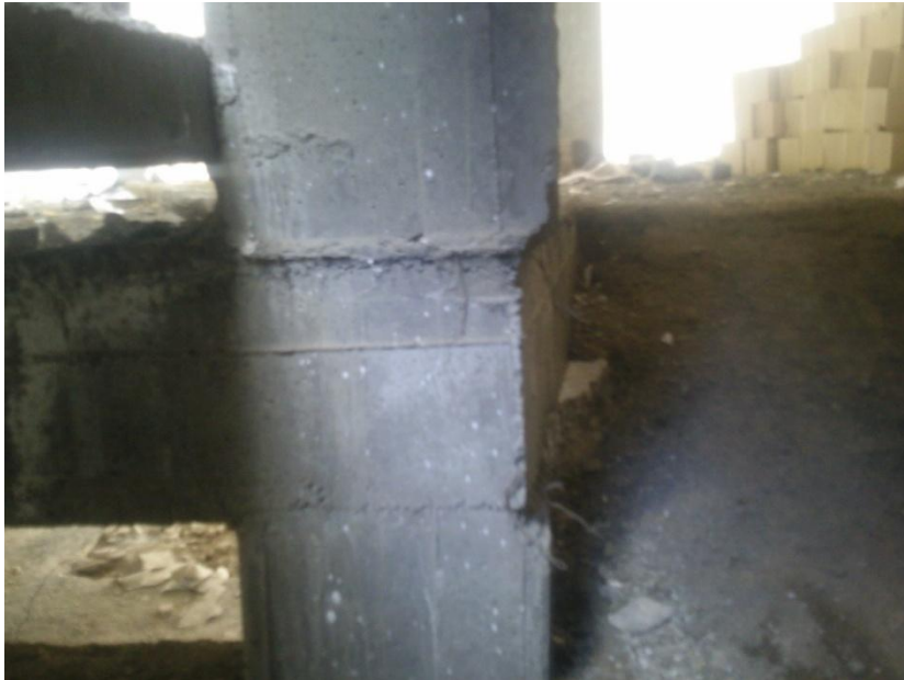
کاهش مقطع ستون در محل اتصال به تیر