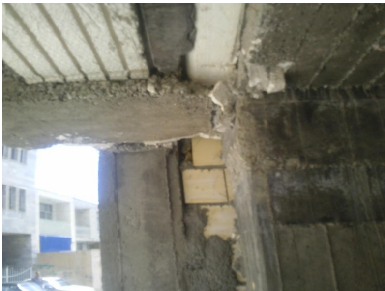
شن زدگی در تیر کنسول