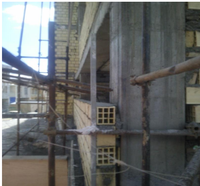
اجرای دیوار خارج از سازه اصلی در پلاک مجاور و محل درز انقطاع