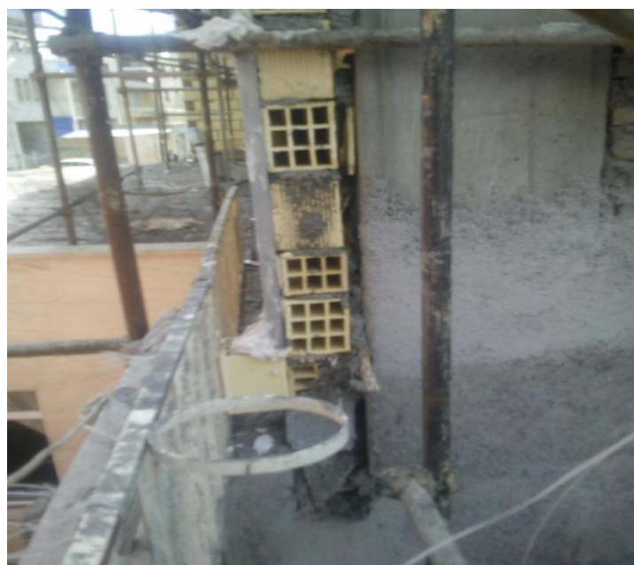
اجرای دیوار خارج از سازه اصلی در پلاک مجاور و محل درز انقطاع