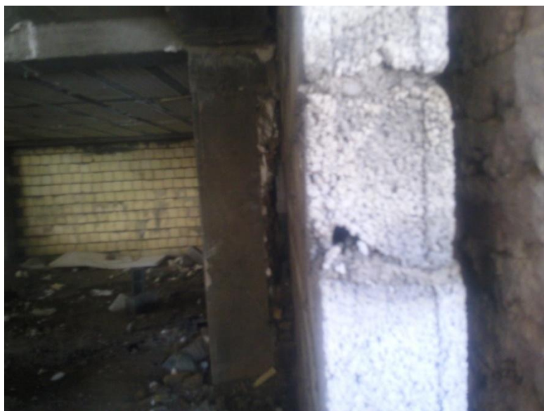
اجرای دیوار خارج از سازه اصلی در پلاک مجاور و محل درز انقطاع