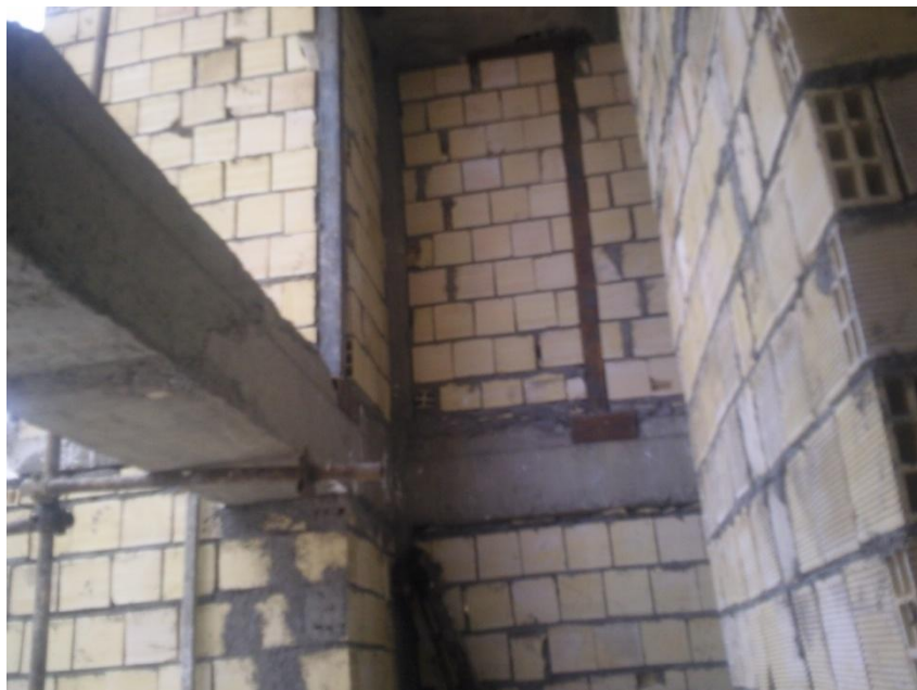
اجرای پایه فولادی بخاطر اتصال ناکافی شمشیری راه پله به سازه اصلی