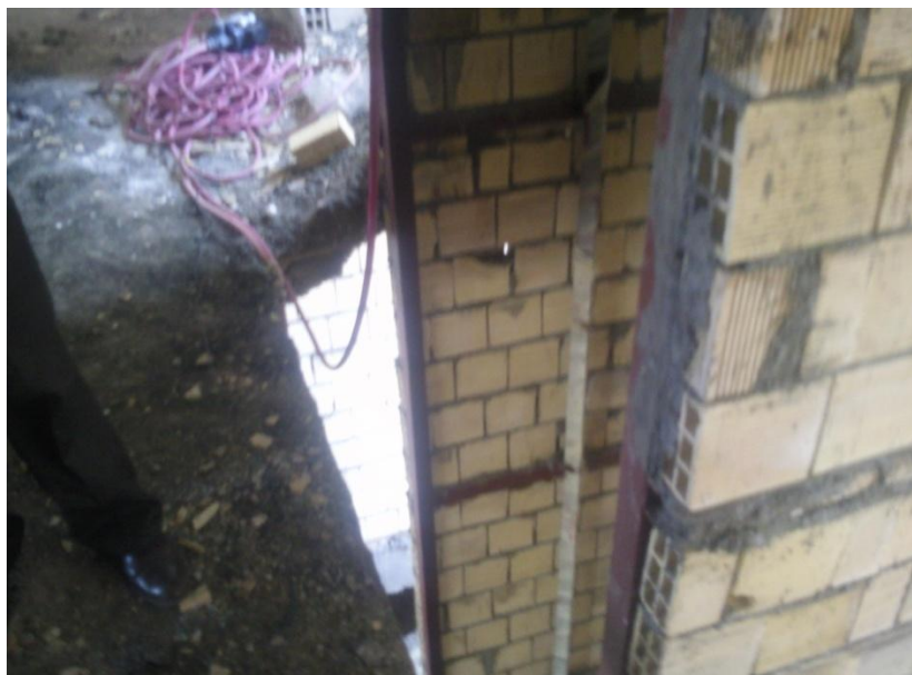
فاصله آسانسور و پاگرد بیشتر از حد معمول و خطر سقوط